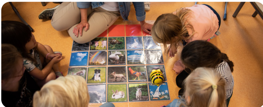
Onderwijstijd verdeeld naar vakken